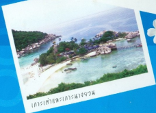
ที่จอดรถ

ห้องที่ว่างสำหรับการแต่งงาน اتاقคู่บ่าวสาว ที่นาคะเจ้า นาคะนางงวน