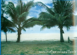
บรรยากาศที่หาดตาคน้ำใสสะอาด

ห้องที่ว่างสำหรับการแต่งงาน اتاقคู่บ่าวสาว ที่นาคะเจ้า นาคะนางงวน