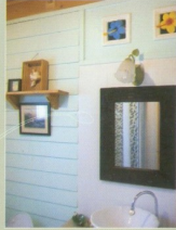
Standard... / 2,000 THB